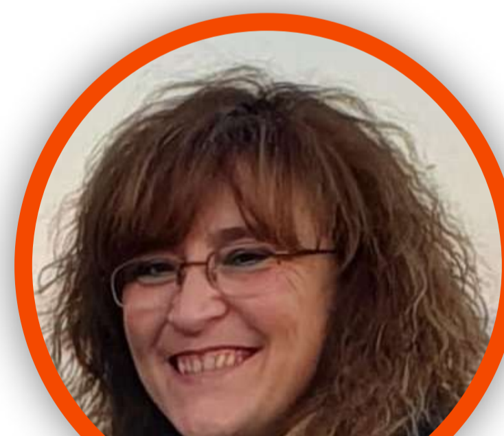
MARIANGELA MAPELLI SCUOLA PRIMARIA