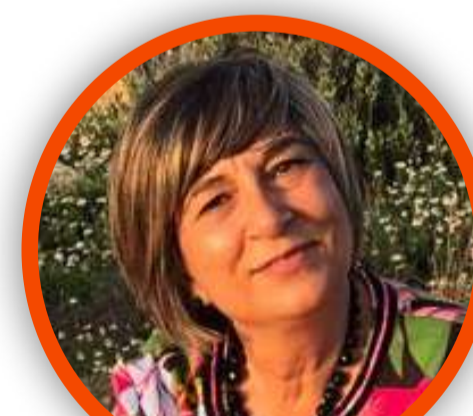
GIOVANNA MARIA BURRELLI SCUOLA PRIMARIA